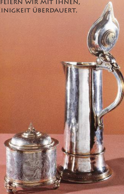
Abendmahlkanne, B. Neuper, 1540/1587 u. Hostienkote, H. Schmidl, 1614/1616

HEUTE FEIERN WIR MIT IHNEN, DENN EINIGKEIT ÜBERDAUERT.