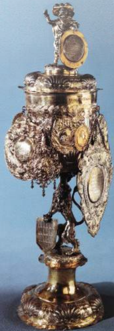
Kirschneinigungsokal, H. Scholler II., 1676

LICHTBOGENSCHWEISSEN (PUK) CAD/CAM GUSS, SCHNITT, GRAVUR U.V.M