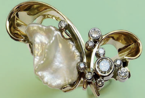
Beitrag zum Wettbewerb Leibnizring 2014 Foto: Goldschmiede Anne-Maria Fischer